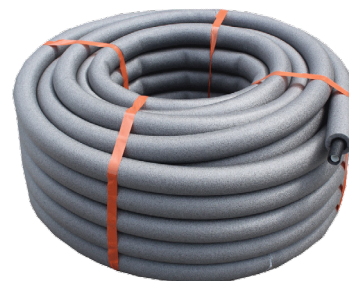
Neotherm PE-RT Rør-i-Rør med isolering